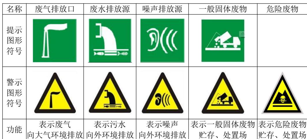
图 9.2-1 排放口图形标志图

⑥环境保护图形标志牌设置位置应距污染物排放口及固体废物堆放场或采样点较近且醒目处，设置高度一般为标志牌上缘距离地面约 2m。